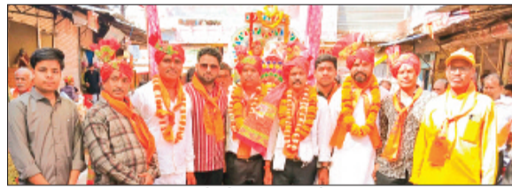
हरिभूमि न्यूज ▶▶ आरोन