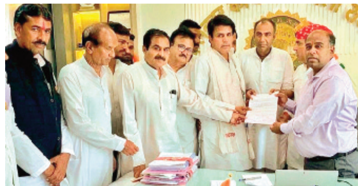
हरिभूमि न्यूज ▶▶ राजगढ़

गोहू की खरीदी के लिए जिले में बनाए गए उपार्जन केंद्रों में सिंदूरिया खरीदी केंद्र का नाम ही सम्मिलित नहीं है जबकि इस गांव व आसपास करीब 50 हजार विन्टल से अधिक गोहू पैदा हुए हैं। ऐसे में खरीदी केंद्र बनाए जाने से आसपास के सैकड़ों किसानों का खाना साकर तय कर एवं पैसा खर्च करते हुए अन्य खरीदी केंद्रों पर पहुंचना पड़ेगा। इस कारण से कांग्रेस