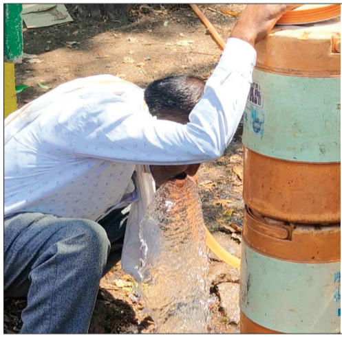
इंतजाम नहीं थे। केवल एक टेंट लगाकर औपचारिकता निभाई गई, जबकि दरी या कुर्सियों की व्यवस्था नहीं होने से लोग खुले

में जमीन पर बैठकर अपनी बारी का इंतजार करते रहे। तेज गर्मी के बीच पेयजल व्यवस्था भी नाकाफी साबित हुई। परिसर में सीमित पानी के केन रखे गए थे, जिन्हें नलकूप के पानी से भरा गया था। टंडे पानी की व्यवस्था नहीं होने से आवेदक परेशान होते दिखे। हालात ऐसे बने कि कई लोग मोटर की पाइप से ही पानी पीकर प्यास बुझाते नजर आए। आवेदकों का कहना था कि यदि मटके या प्याऊ की समुचित व्यवस्था होती तो काफी राहत मिल सकती थी।