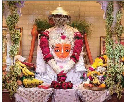
भैरूदा। नगर के बजरंग कुटी स्थित खेड़ापति सरकार को सवा क्विंटल अंगूरों के गुच्छे से सजाया गया। सुबह से ही यहां भक्तों का जमावड़ा लगा था।

भैरूदा। गुरुवार को हनुमान जन्मोत्सव पूरे नगर सहित तहसील क्षेत्र में श्रद्धा, उल्लास और भक्ति के वातावरण में धूमधाम से मनाया गया। इस पावन अवसर पर सुबह से ही हनुमान मंदिरों में भक्तों की भारी भीड़ उमड़ पड़ी। मंदिर परिसर "जय श्रीराम" और "जय हनुमान" के जयघोष से गुंज उठे, जिससे पूरा वातावरण भक्तिमय हो गया।